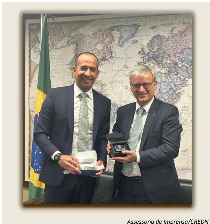
Assessoria de Imprensa/CREDN

Em 22 de maio de 2023, o Presidente da Comissão de Relações Exteriores e de Defesa Nacional (CREDN), Deputado Paulo Alexandre Barbosa, reuniu-se com o Embaixador da União Europeia no Brasil, Ignacio Ybáñez. À ocasião, foi confirmado encontro o embaixador com um grupo de deputados do Parlamento Europeu, com os quais irá dialogar sobre temas como a ratificação do Tratado de Livre Comércio MERCOSUL – União Europeia.