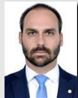
Eduardo Bolsonaro (PL/SP)