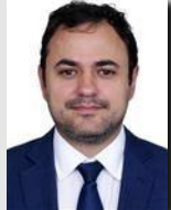
Glauber Braga (PSOL/RJ)