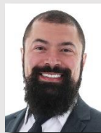
Delegado Paulo Bilynskyj (PL/SP)