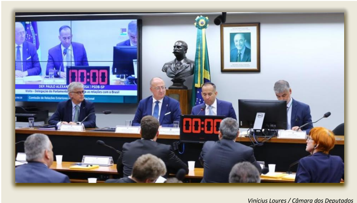
Vinicius Loures / Câmara dos Deputados

Membros da Comissão de Relações Exteriores e de Defesa Nacional (CREDN) receberam, em 16 de maio de 2023, um grupo de deputados do Parlamento Europeu, marcando a retomada do diálogo parlamentar entre o Brasil e a Europa.