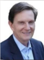
Marcelo Crivella (REPUBLICANOS/RJ)