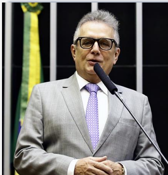
1º Vice-Presidente DEPUTADO FLÁVIO NOGUEIRA (PT/PI)