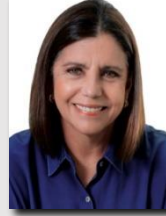
Roseana Sarney (MDB/MA)