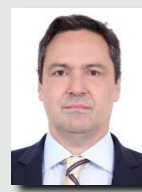
Luiz Philippe de Orleans e Bragança (PL/SP)