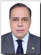
Paulo Abi-ackel (PSDB/MG)