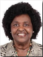
Benedita da Silva (PT/RJ)