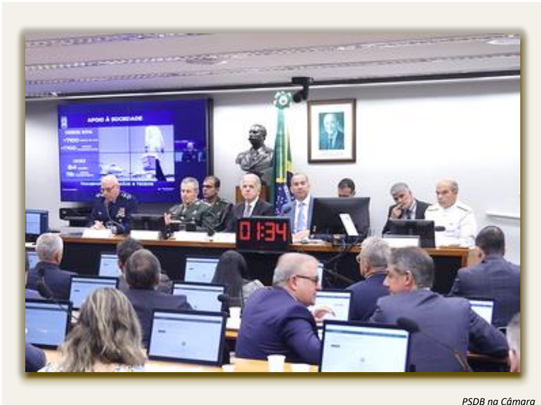
PSDB na Câmara

A Comissão de Relações Exteriores e de Defesa Nacional da Câmara dos Deputados recebeu, em 17 de maio de 2023, o Ministro da Defesa, José Múcio Monteiro Filho, para discorrer sobre as prioridades da pasta em 2023 e outros temas da área da Defesa.