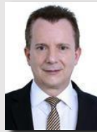
Celso Russomanno (REPUBLICANOS/SP)