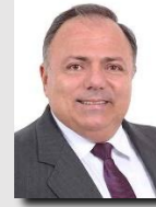
General Pazuello (PL/RJ)