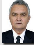
General Girão (PL/RN)