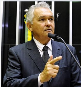
2º Vice-Presidente DEPUTADO GENERAL GIRÃO (PL/RN)