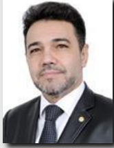
Pr. Marco Feliciano (PL/SP)