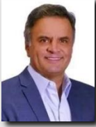
Aécio Neves (PSDB/MG)