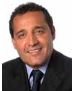
DELEY PSC - RJ

Gabinete 218 Anexo 4 Fone 3215-5218 Fax 3215-2218