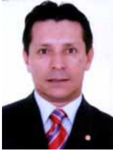
CAPITÃO ASSUMÇÃO PSB - ES