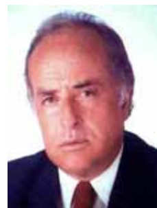
JOSÉ SANTANA DE VASCONCELLOS PR - MG

dep.josesantanadevasconcellos@camara.gov.br