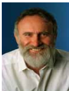
DR. ROSINHA PT - PR

Gabinete 565 Anexo 3 Fone 3215-5565 Fax 3215-2565