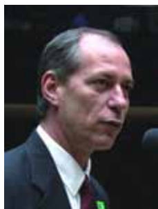
CIRO GOMES PSB - CE

Gabinete 402 Anexo 4 Fone 3215-5402 Fax 3215-2402