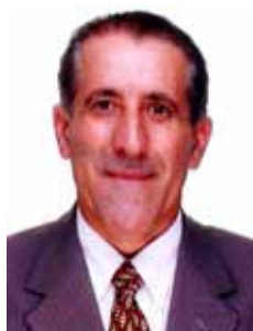
ZONTA PP - SC

Gabinete 571 Anexo 3 Fone 3215-5571 Fax 3215-2571