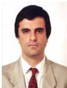
JOSÉ EDUARDO CARDOZO PT - SP