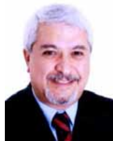
DR. NECHAR PP - SP

Gabinete 926 Anexo 4 Fone 3215-5926 Fax 3215-2926