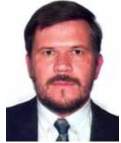
ASSIS DO COUTO PT - PR

Gabinete 410 Anexo 4 Fone 3215-5410 Fax 3215-2410