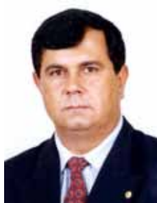
CHICO DA PRINCESA PR - PR

Gabinete 848 Anexo 4 Fone 3215-5848 Fax 3215-2848