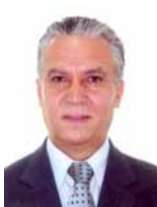
MAGELA PT - DF

Gabinete 569 Anexo 3 Fone 3215-5569 Fax 3215-2569