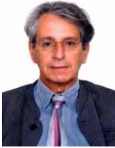
FERNANDO GABEIRA PV - RJ