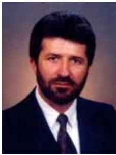
GONZAGA PATRIOTA PSB - PE

Gabinete 232 Anexo 4 Fone 3215-5232 Fax 3215-2232