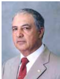
TATICO PTB - GO