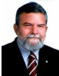
BETINHO ROSADO DEM - RN