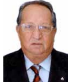
PROFESSOR RUY PAULETTI PSDB - RS

Gabinete 734 Anexo 4 Fone 3215-5734 Fax 3215-2734