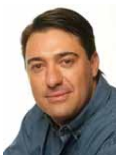
GIACOBO PR - PR

Gabinete 418 Anexo 4 Fone 3215-5418 Fax 3215-2418