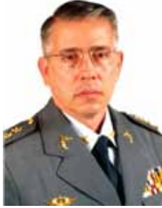
PAES DE LIRA PTC - SP