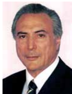
MICHEL TEMER PMDB - SP

Gabinete 508 Anexo 4 Fone 3215-5508 Fax 3215-2508