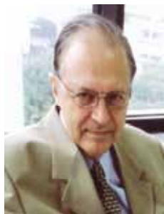
ANTONIO CARLOS MENDES THAME PSDB - SP

dep.antoniocarlosmendesthame@camara.gov.br