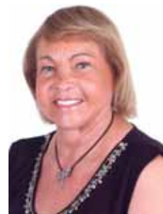
NICE LOBÃO DEM - MA

Gabinete 340 Anexo 4 Fone 3215-5340 Fax 3215-2340