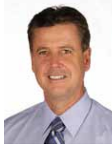
RODRIGO ROLLEMBERG PSB - DF

Gabinete 476 Anexo 3 Fone 3215-5476 Fax 3215-2476