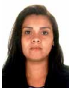
SUELY PR - RJ

Gabinete 812 Anexo 4 Fone 3215-5812 Fax 3215-2812