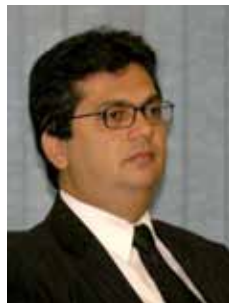
FLÁVIO DINO PCdoB - MA

Gabinete 422 Anexo 4 Fone 3215-5422 Fax 3215-2422