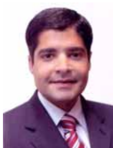
ANTONIO CARLOS MAGALHÃES NETO DEM - BA

dep.antoniocarlosmagalhaesneto@camara.gov.br