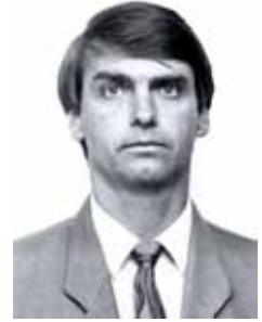
JAIR BOLSONARO PP - RJ

Gabinete 333 Anexo 4 Fone 3215-5333 Fax 3215-2333