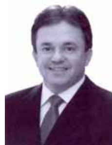
VANDER LOUBET PT - MS

Gabinete 473 Anexo 3 Fone 3215-5473 Fax 3215-2473