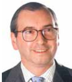
EDUARDO CUNHA PMDB - RJ