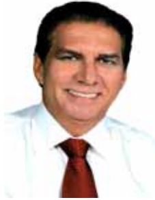
JADER BARBALHO PMDB - PA

Gabinete 752 Anexo 4 Fone 3215-5752 Fax 3215-2752