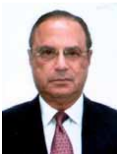
PAULO MALUF PP - SP

Gabinete 903 Anexo 4 Fone 3215-5903 Fax 3215-2903