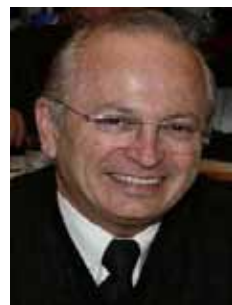
DR. UBIALI PSB - SP

Gabinete 454 Anexo 4 Fone 3215-5454 Fax 3215-2454