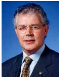
LUIZ CARLOS HAULY PSDB - PR