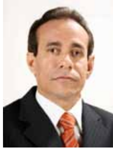
PINTO ITAMARATY PSDB - MA

Gabinete 933 Anexo 4 Fone 3215-5933 Fax 3215-2933