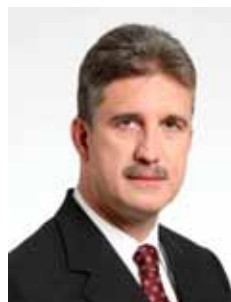
MILTON MONTI PR - SP

Gabinete 638 Anexo 4 Fone 3215-5638 Fax 3215-2638