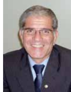
CHICO D'ANGELO PT - RJ

Gabinete 633 Anexo 4 Fone 3215-5633 Fax 3215-2633