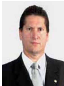
JILMAR TATTO PT - SP

Gabinete 840 Anexo 4 Fone 3215-5840 Fax 3215-2840