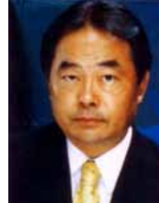
TAKAYAMA PSC - PR

Gabinete 628 Anexo 4 Fone 3215-5628 Fax 3215-2628