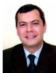
IRAN BARBOSA PT - SE

Gabinete 26 Anexo 2 Fone 3215-8171 Fax 3215-2963