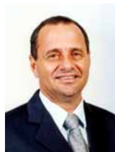
MANATO PDT - ES

Gabinete 370 Anexo 3 Fone 3215-5370 Fax 3215-2370