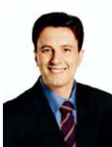
VIGNATTI PT - SC

Gabinete 711 Anexo 4 Fone 3215-5711 Fax 3215-2711